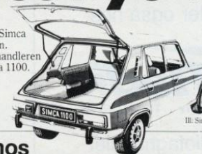
Il. Simca 1100 ES

De og Deres familie - og Simca 1100. Den ideelle kombination. Kom ind til Chrysler-forhandleren og mød Deres nye ven - Simca 1100. Priser fra kr. 38.988,- ex. lev.