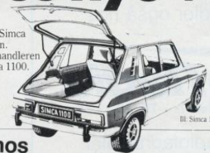
Bl. Simca 1100 ES

De og Deres familie - og Simca 1100. Den ideelle kombination. Kom ind til Chrysler-forhandleren og mød Deres nye ven - Simca 1100. Priser fra kr. 38.988,- ex. lev.