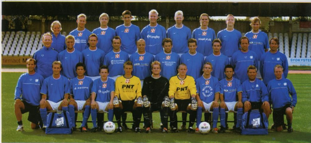
2. DIVISION 2003/2004 6. SPILLERUNDE SØNDAG 7. September 2003 LYNGBY STADION K.O. 13.00