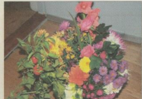
Farverig høst i oktober. Læs tekst om spændens indhold.

te og tørreste september. Det skal siges, at jeg for en stor del har stauder i min ca. 500 m 2 store have. Asters findes i mange blålige og rødlig nuancer samt i hvidt, både høje og lave. De højeste er Aster novae-anglia på 120-150 cm. De gror i en tæt