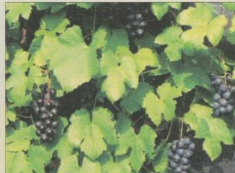
Lækre, søde vindruer af sorten 'Schuyler' i hele oktober. Får ikke meldug og er frugtbar.

Ligesom principperne i en Feng Shui have, hvor alle sanserne skal stimuleres, så jeg nyder også saftige, søde vindruer (se billede), de sidste sveskeblommer og brombær samt sprøde, knasende æbler. De blå kartofler ligger i jorden og venter på at blive taget op, porrerne strutter af vitaminer og duften af nyhøstet rucola, persille og andre krydderurter gør slutningen af denne oktoberdag ekstra dejlig. Se også billedet af mine Yin Yang bønner, når vi nu taler om Feng Shui principper. De beholder for en stor del farverne efter kogning og tilberedes som almindelige hvide bønner med iblodsætning og kogning. Man kan også lave flotte perlekæder af bønnerne. Dyrkningen er let, men de ynder som andre bønner en varm sommer. Se på billedet af spanden med blomster - samt opgravede chiliplanter med frugter. Det er dagens