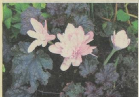
Efterårsblomstrende Colchicum 'Waterlily' (giftig) med markbladet Heuchera 'Stormy Seas'.

te og tørreste september. Det skal siges, at jeg for en stor del har stauder i min ca. 500 m 2 store have. Asters findes i mange blålige og rødlig nuancer samt i hvidt, både høje og lave. De højeste er Aster novae-anglia på 120-150 cm. De gror i en tæt