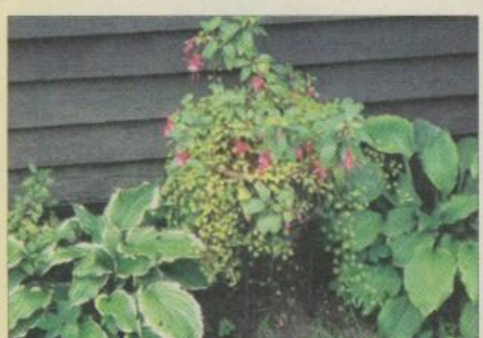
Fuchsia i krukke hævet over Hosta giver farve om efteråret.