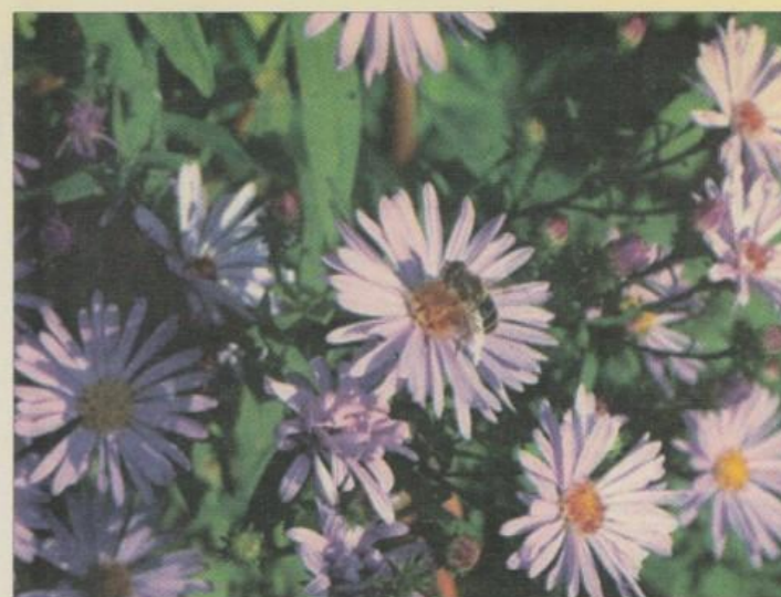
Sentblomstrende stauder er vigtige for havens insekter.

klump og spreder sig kun langsomt. Til de Asters, som spreder sig med underjordiske udlobere hører de høje Aster novi-belgii og de lave Aster domosus, som begge blomstrer i oktober. Der findes også flere andre arter end nævnt her. Asters har selskab af Duehoved (Chelone), Sankt Hans Urt, Colchicum 'Waterlily' (se billede), de sidste Høstflok (Phlox paniculata), den meget flotte blå Blyrod (Ceratostigma), Drejeblostm (Physostegia 'Vivid'), Høstanemoner samt monterende roser. I det hvide bed står 'Brunetten' (Cimicifuga ramosa