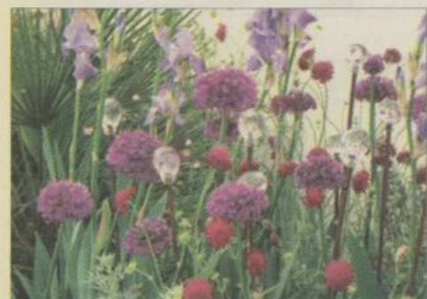
Planlæg foråret om efteråret, læg forårsblomstrende løg. Her prydløg med Iris og Knautia macedonica. Juni.