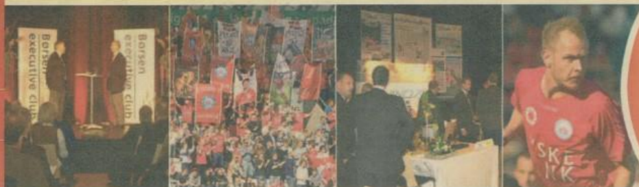
... Børsen executive club