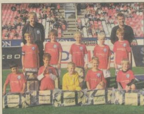
SIFs hold i SuperPut-turneringen strøg i finalen efter en rimelig komfortabel 9-0 sejr i sidste runde.