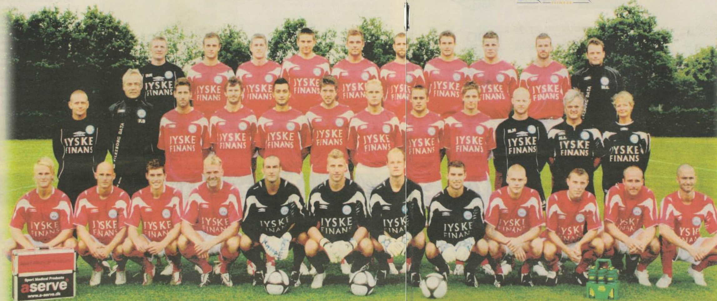
SIFTRUPPEN EFTERÅRET 2008