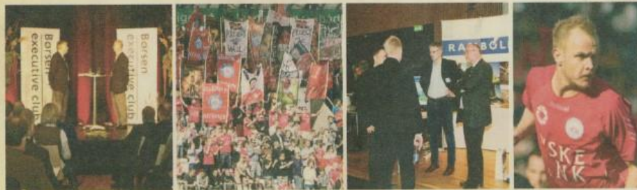
... Børsen executive club