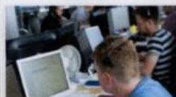
Den bedste og mest fleksible service

Firmaet har eksisteret siden 2004 og vores veluddannede og dygtige medarbejdere håndterer hver dag en stor mængde gods via moderne og branchespecifikke it-systemer og med en nyere flåde af biler og chassier.