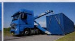
Leveringsikkerhed i top