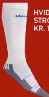
HVIDE STRØMPE KR. 129,00