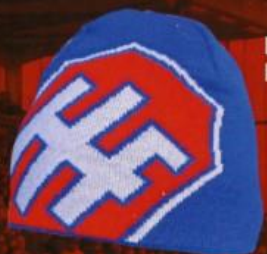
BEANIE KR. 100,00