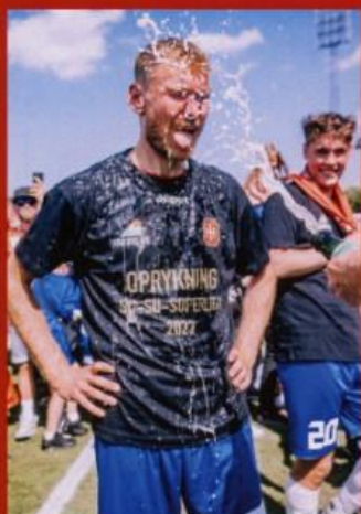
SORTE OPRYKNINGS- T-SHIRT KR. 299,00