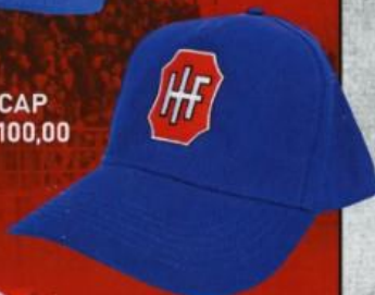
HIF CAP KR. 100,00