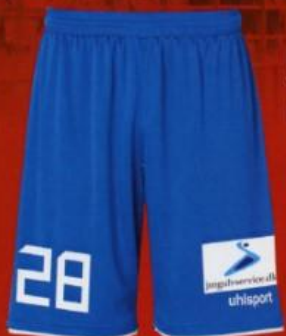
KAMPBUKSER BLÅ VOKSEN KR. 250,00