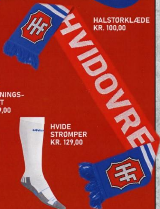
HALSTØRKLÆDE KR. 100,00