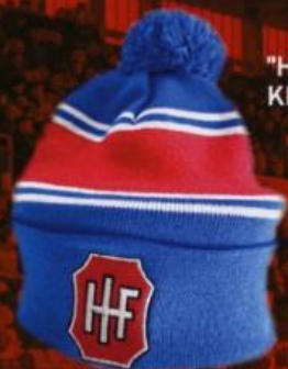
"HOCKEY HUE" KR. 150,00